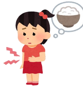
子どもの貧困の原因