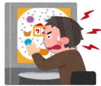
知られざるギャンブル依存症という病